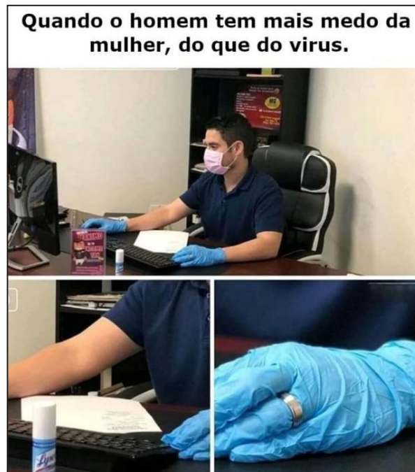
Figura 3. O homem como vítima passiva.

outro lugar. Os memes dão a entender que, agora, ele é forçado a ficar em casa e a realizar atividades típicas do lar, como passar roupas, lavar louça e cozinhar. O homem é colocado como vítima das ordens da mulher e as obedece para não sofrer consequências.