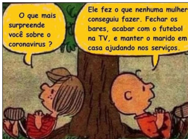
Figura 2. Na vida conjugal, a mulher é a carcereira.

No contexto de uma pandemia, surge aquela simplificação da relação do casal, em que a mulher consegue o que sempre quis: o homem em casa. Por sua vez, aquele homem que sempre tenta não voltar para casa, que em um período regular o consegue com trabalho, futebol, amigos ou cerveja, neste cenário de confinamento é forçado a permanecer no local de onde costuma tentar fugir, conforme Figura 2. Diante disso, suas reações são, basicamente, de dois tipos: aceitar passivamente ou rebelar-se.