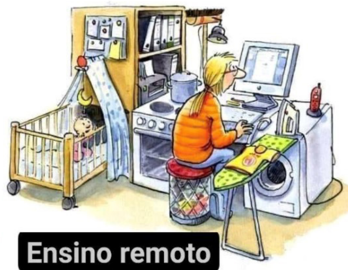
Figura 7. A sobrecarga materna.

Em meio à complexidade de conciliar as atividades domésticas com o trabalho, um conjunto de memes deixa evidente que a mãe quem arca com o maior fardo desse trabalho, conforme se observa na Figura 7.