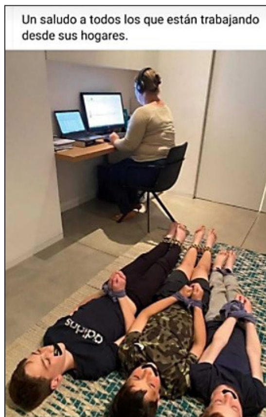
Figura 6. O caos doméstico. [Saudações a todos os que estão trabalhando em suas casas].

O material analisado demonstra que a situação com crianças é complexa e, quando são pequenas, torna-se incontrolável. Não há possibilidade de trabalho remoto (Figura 6), pois as demandas dos filhos ocupam todo o tempo e energia. As famílias perderam, repentinamente, o suporte da escola e, na maioria dos casos, também dos ajudantes domésticos.