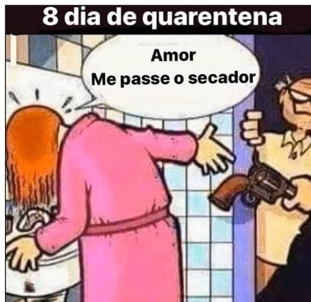
Figura 4. Rebelar-se contra o cárcere.

Pode-se observar, portanto, um processo de naturalização da violência, pois a morte é colocada como uma opção válida para escapar da tortura da vida de casal. A naturalização da violência aparece neste espaço como forma de fugir da suposta situação de opressão (Beltrán, 2016; Casado, 2017), como se nota na Figura 4.